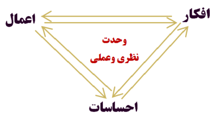
شکل ۱: کارکرد اجتماعی دین

به تدریج این مفهوم از زمان مسافرت دریایی اروپایی‌ها به سایر سرزمین‌ها و کشورها از فضای تعریف یک طبقه به سمت تعریف ویژگی یک جامعه پیشرفت. اروپایی‌ها ناچار بودند برای ماندن در کشورهای مستعمره، زبان و آداب آن‌ها را بشناسند. آن‌ها می‌دیدند چیزی در کشورهای خود دارند که در کشورهای مستعمره نیست و اسم آن‌را فرهنگ گذاشتند و لذا به مرور، اسم جوامع خود را با فرهنگ گذاشتند و جوامع استعمار شده را «عقب‌مانده» نامیدند. در پی این جریان بود که به مرور زمان مفهوم فرهنگ به یک مفهوم هنجاری و دو دسته‌ساز